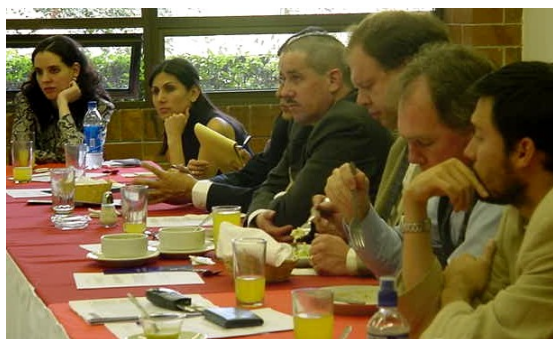
Participantes en la IIª Convención Constitucionalista.

El 31 de enero el Centro para el Análisis de las Decisiones Públicas organizó la IIª Convención Constitucionalista en la Universidad Francisco Marroquín con el objetivo de recabar las impresiones de un grupo de abogados distinto a los invitados a la Iª Convención , realizada en octubre del 2001.