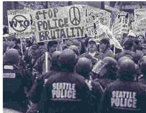
Manifiestación anti globalización en Nápoles (Italia) en protesta por la reunión del Tercer Foro Global ("Third Global Forum"). Marzo de 2001.

La batalla en favor de la libertad constituye una ardua tarea cuyo saldo no siempre es positivo. En algunas latitudes se libra denodadamente para lograrla; en otras está orientada a ampliarla o, por lo menos, a preservar la libertad que se ha ganado.