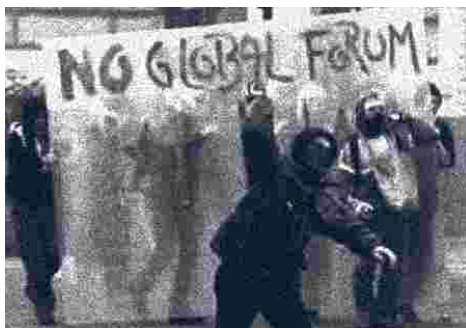
La policía anti-disturbios de Seattle (EE UU) mantiene la calle cortada frente a los manifestantes, que portan pancartas con lemas pacifistas y en contra de la brutalidad policial. Se trata de la reacción a los métodos violentos empleados por las fuerzas del orden para disolver la protesta contra la Organización Mundial del Comercio (OMC, 'World Trade Organization, WTO').

Otros discursos, sin embargo, son aceptados fervorosamente por personas inteligentes y defendidos con derroche de sinceridad, no obstante ser tan destructivos de la sociedad como la violencia marxista-leninista; la única diferencia es el tipo de armamento empleado para socavar, debilitar y destruir la vida societaria. Es decir, sólo cambia el tipo de terrorismo. Uno de esos discursos es aquel que pertenece a lo que aquí de-